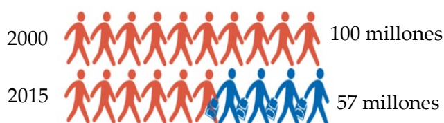
Gráfico I: Niños y niñas en el mundo, en edad de recibir educación primaria, que no acuden a la escuela.

El ODS 4 renueva este compromiso incompleto de la educación primaria universal, reafirma la igualdad de oportunidades en el acceso a la enseñanza, pero va más allá con un alcance más amplio comprometiendo a todos los países a lograr una educación de calidad en todos los niveles educativos - 263 millones de niños, niñas, adolescentes y jóvenes no asistían a la escuela en 2014 y más de 100 millones de jóvenes seguían siendo analfabetos en 2015 6 - que sea efectiva y con un enfoque de aprendizaje a lo largo de todas las etapas de la vida.